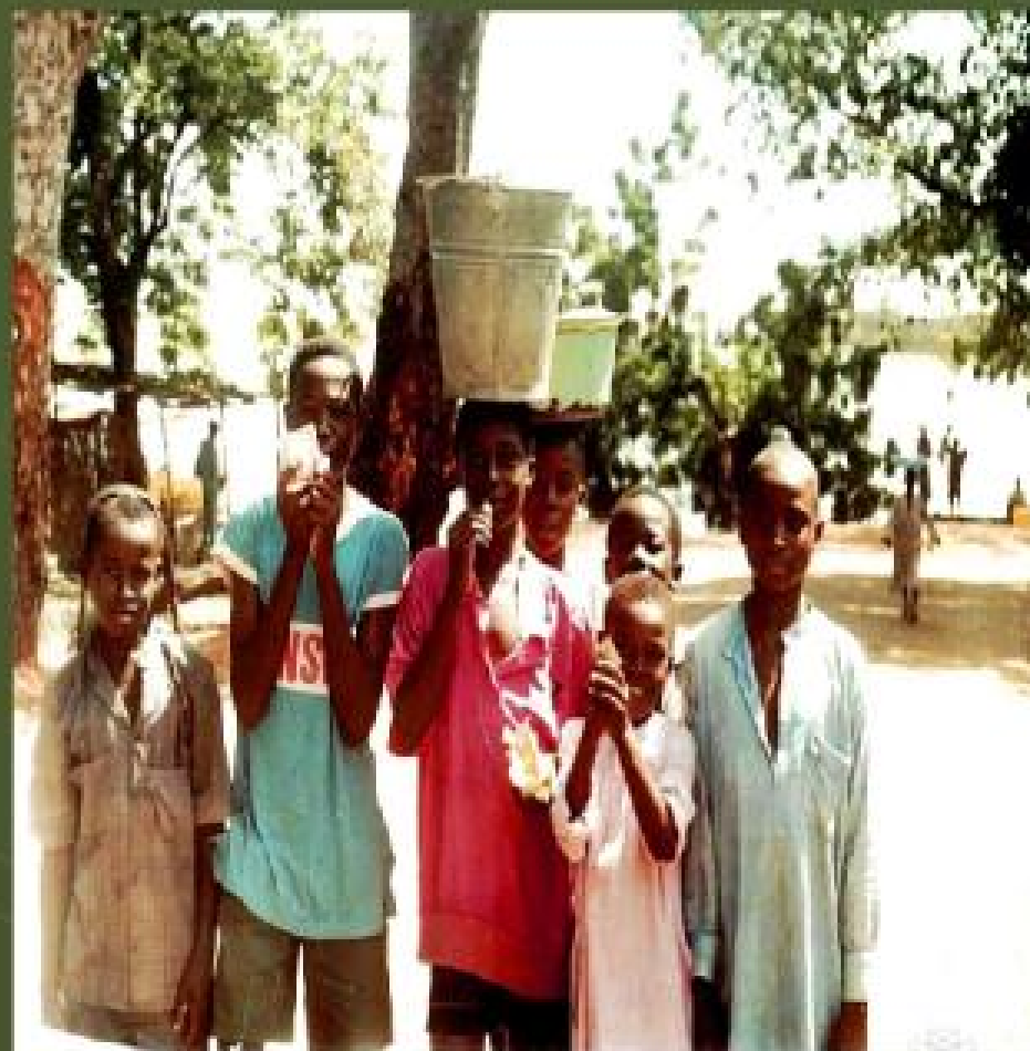
Нигерия, г. Локоджа, октябрь 1993г.