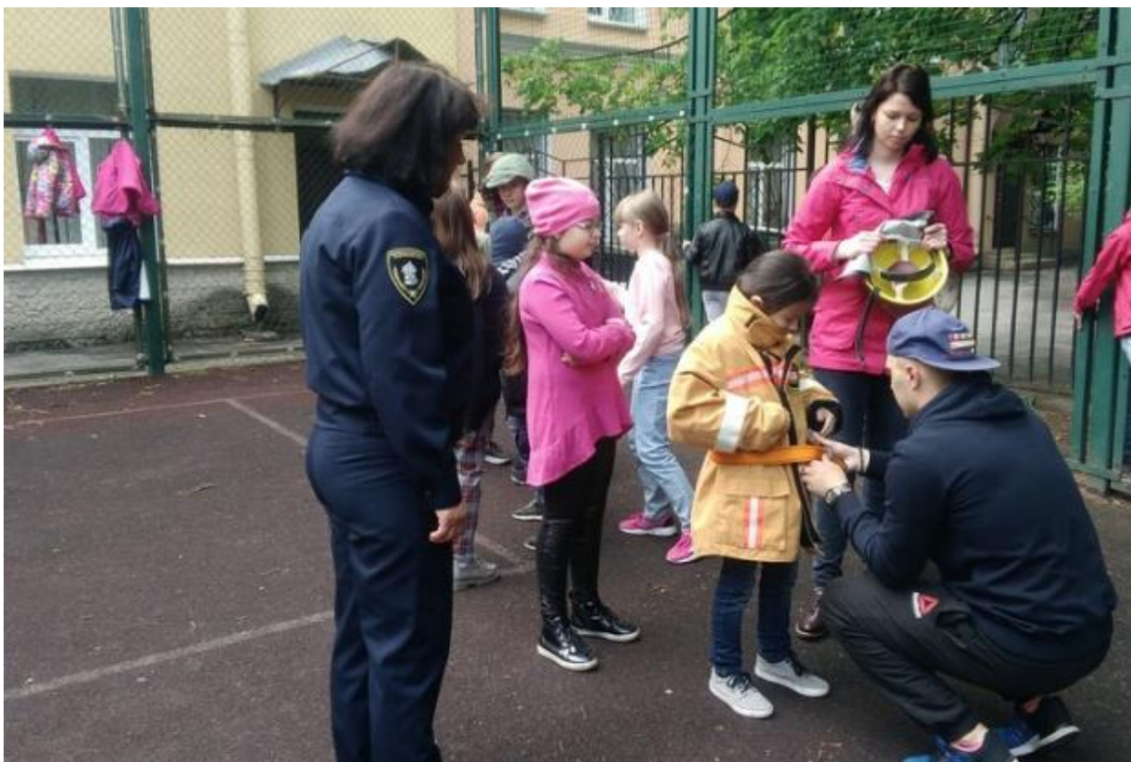
ОНДПР Центрального района ГУ МЧС России по Санкт-Петербургу 25.06.2019