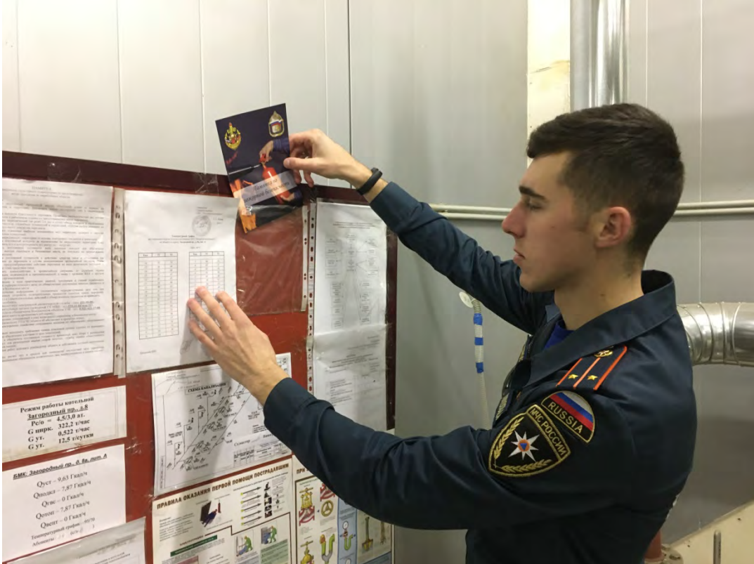
ОНДПР Центрального района 22.11.2019