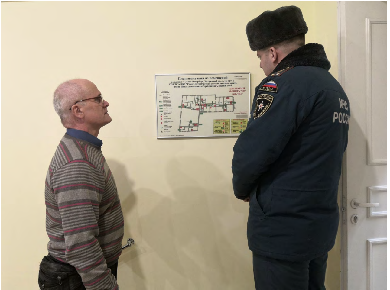
ОНДПР Центрального района 20.03.2020