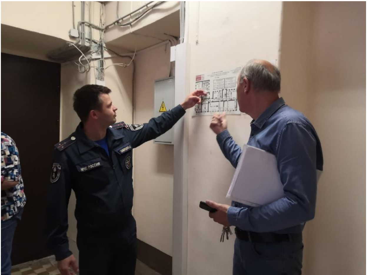
Управление по Центральному району 20.07.2020